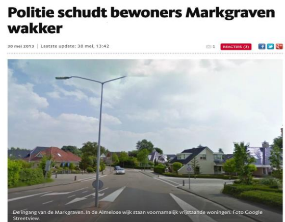
Initiatief wijk Markgraven Almelo

Het was afgelopen met de inbraken in de wijk. Eenzelfde soort initiatief ontstond in een aantal wijken in Almelo en wel de wijken de Markgraven en Het Nijrees. Doordat wijkbewoners het niet meer "pikten" dat er in hun wijk werd ingebroken kwamen ze letterlijk in actie en daalde het aantal