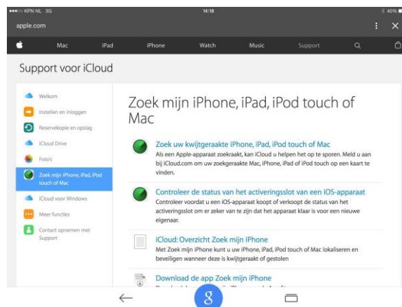
Zoek mijn ipad/iphone