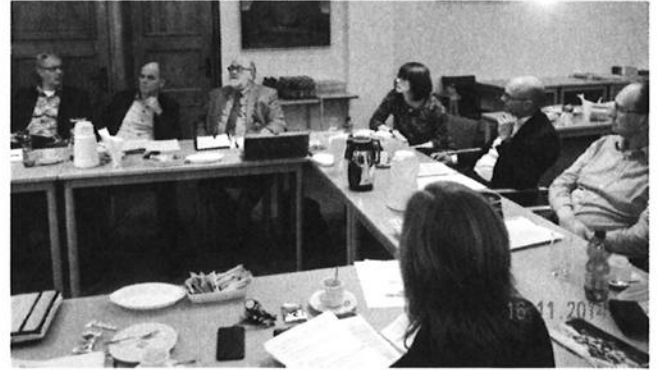
EUREGIONale stuurgroep in discussie over mogelijke vormen van juridische overeenkomsten voor grensoverschrijdende spoedzorg in november 2015

Standaardconvenant grensoverschrijdende spoedzorg: Op dit moment wordt een tussenweg gezocht middels de uitwerking van een standaardconvenant voor de hele EUREGIO, welke, waar nodig, voor enkele regio's aangepast kan worden. Het standaardconvenant zal in de eerste helft van 2016 gereed zijn.