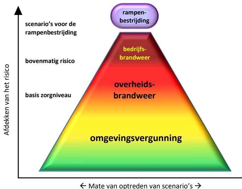
Figuur 1 Risicoafdekking openbare veiligheid

In onderstaand figuur staat weergegeven hoe ze zich tot elkaar verhouden.