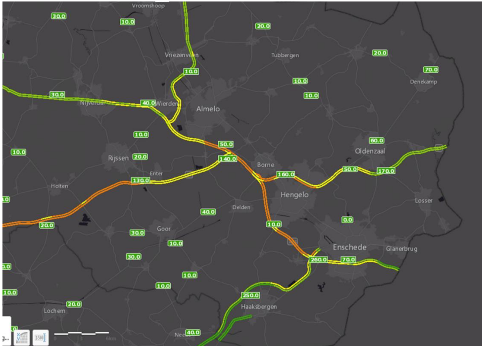
Figuur 1: Rijkswegen in Twente. Kleuren geven een indicatie van de intensiteit in de avondspits.

In figuur 1 is het rijkswegennet in Twente weergegeven. De kleuren geven tevens een indruk van de drukst bereiden delen in het wegennet, waarbij het deel tussen de knooppunten het meest drukke traject is met circa 100.000 voertuigen per dag (beide richtingen gezamenlijk).