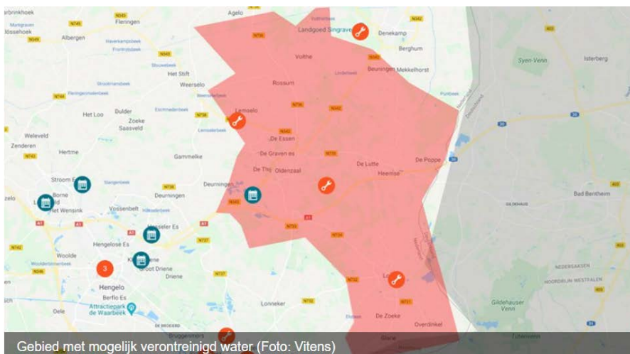
Figuur 1: gebied met mogelijk verontreinigd drinkwater. Dit is het gebied zoals dat in de loop van vrijdag 3 september duidelijk is geworden

Het gaat om het volgende gebied met daarin ca 26.000 huishoudens.